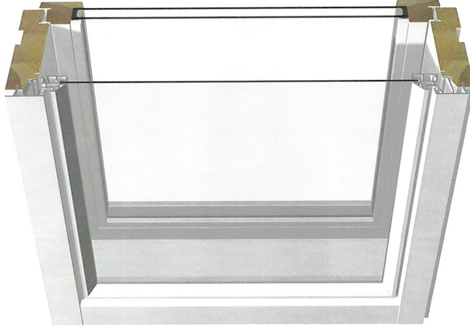
Finska 2 + 1 -glasfönster